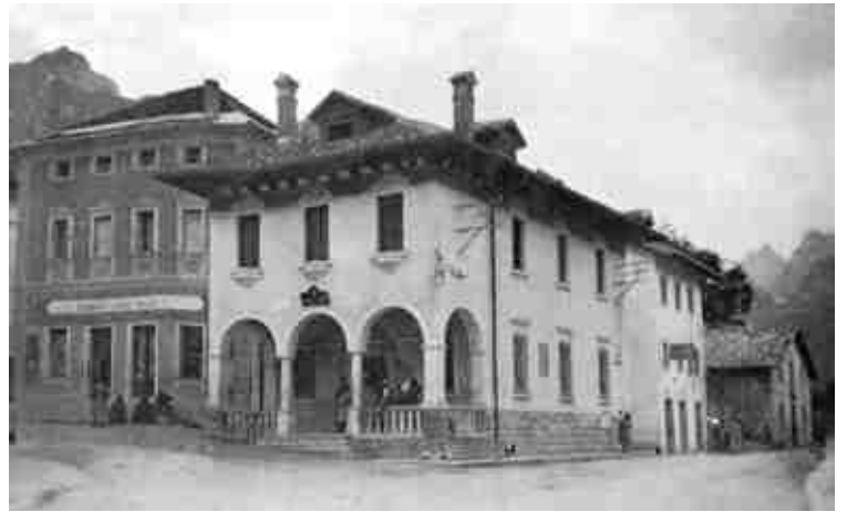
Inizio Novecento: a fianco della farmacia Favretti non c'è più la chiesa di San Pietro (demolita nel 1916) ma un palazzo con loggia ad archi (un tempo ufficio postale, oggi istituto bancario).

Nella bolla di papa Lucio del 1185 vengono ricordate, in parti diverse del documento, sia la "plebem de Agorde cum cappellis suis" sia la "curtem de Agorde cum Comitatu et