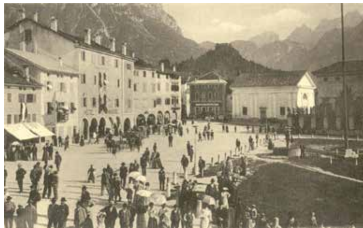
Chiesa di San Pietro all'angolo destro della piazza di Agordo: alla sua sinistra la farmacia Favretti, alla sua destra la villa Crotta-de' Manzoni

L'aspetto esterno della chiesa e la sua collocazione sono ricostruibili grazie ad alcune fonti iconografiche di diversa epoca: fotografie di inizio Novecento; mappe ottocentesche del Catasto austro-italiano, conservato all'Archivio di Stato di Belluno, consultabili in internet; due mappe del 1750 e 1751, conservate all'Archivio di Stato di