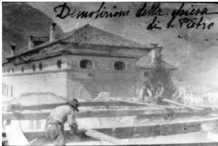
Due momenti della demolizione della chiesa di san Pietro, nel 1916, per allargare la strada e consentire il transito dei mezzi militari in guerra.

luno, Aimone, di origine franca, abbia istituito nel corso del IX secolo il Capitolo dei canonici della cattedrale; Tamis ipotizzava che "la pieve collegiale di Agordo fosse separata dalla cattedrale già nel IX secolo". Sicuramente Aimone, grazie alla donazione dell'imperatore Berengario I del 923, venne in possesso delle "decime di Agordo", che, sempre secondo Tamis, "non dovevano essere altro che prestazioni feudali o corrisposte di vario genere dovute dagli Agordini al gruppo centrale longobardo della curtis"; Tamis prosegue affermando che dopo il 923 si costituì certamente ad Agordo una curtis vescovile che, in via di ipotesi, si potrebbe identificare con la parte antica del palazzo Crotta - de' Manzoni. La dipendenza di arimannie da questa corte vescovile è stata ritenuta un indizio di una precedente dominazione longobarda. Si può quindi supporre che la curtis vescovile fosse stata preceduta da una curtis longobarda: nel centro di Agordo potrebbe essere stata costruita una sala, termine che inizialmente indicava una "costruzione con un solo grande vano" e divenne poi un termine specificamente longobardo, indicando la "casa per la residenza padronale nella curtis e per la raccolta delle derrate dovute al padrone", passando infine a indicare semplicemente la "casa di campagna". In un articolo sulle modalità insediative dei Longobardi, riferite in particolare al ducato di Ceneda, da cui dipendeva probabilmente la sculdascia di Belluno, si legge: "la normativa edilizia