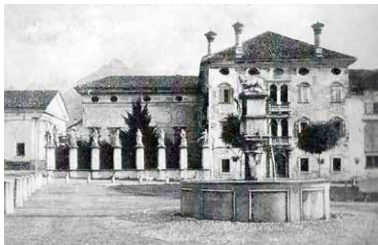
Fontana sul Broi e palazzo Crotta - de' Manzoni, con l'angolo della chiesa di S. Pietro, a sinistra.